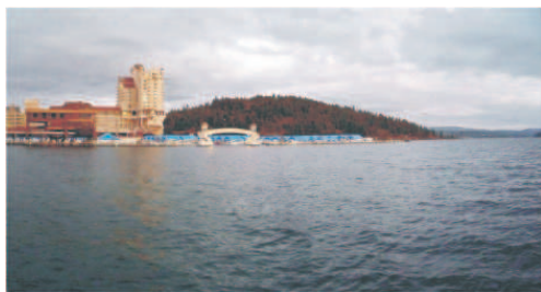
Coeur d'Alene: il lago