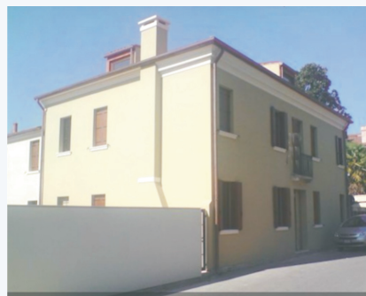
La Casa S. Andrea in Via Sichirolo