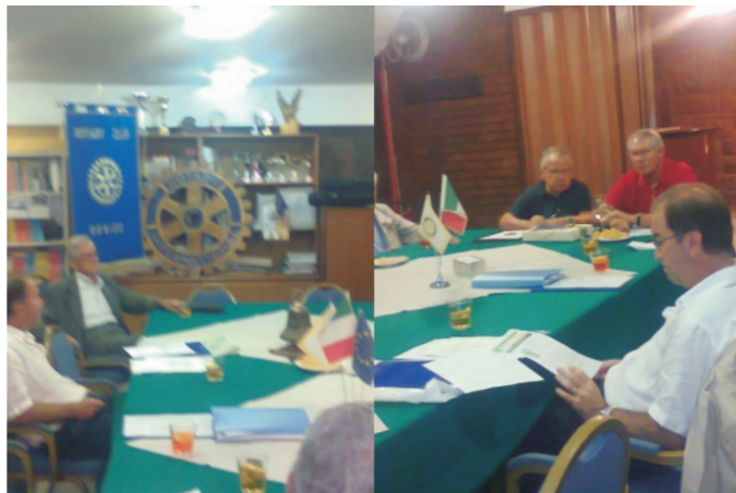
Così al caminetto in taverna