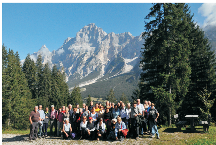
I partecipanti al 29 incontro sotto l'Antelao