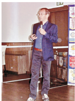
Rotary Club di Rovigo Martedì 25 settembre 2012

(G.A.) L'arrivo di stranieri che si stabiliscono in Italia è un fatto di grande rilievo. La scelta dell'Italia per immigrarvi potrebbe avere più di una motivazione. Forse la principale risiede nel notevole grado di sviluppo economico raggiunto dal nostro paese, prima dell'attuale momento di crisi. Ma l'aspetto più rilevante sta nel fatto di vedere il nostro paese trasformato da terra di emigrazione a luogo di immigrazione.